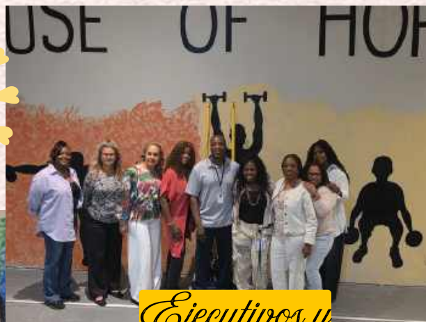
Ejecutivos y Consejo de Administración